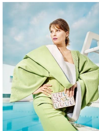
Les Bains des Docks, Le Havre