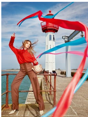
Le Phare, Saint-Vaast-la-Hougue