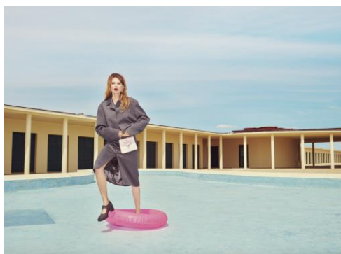
Les Bains Pompéiens, Deauville