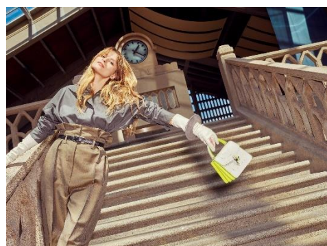
La Cité de la Mer, Cherbourg