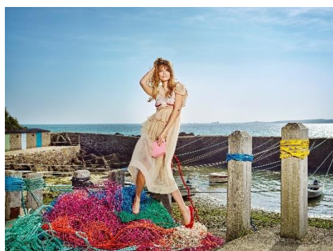
Nez de Jobourg, Port Racine