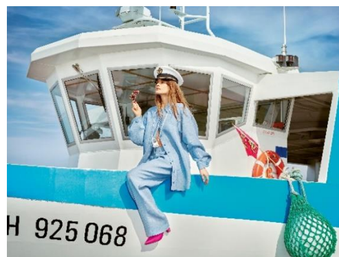
Île Tatihou, Saint-Vaast-la-Hougue