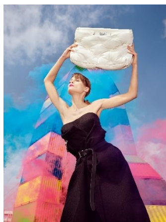
Catène de containers, Le Havre