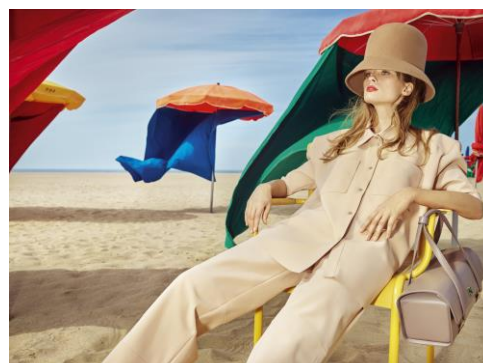
La Plage, Deauville