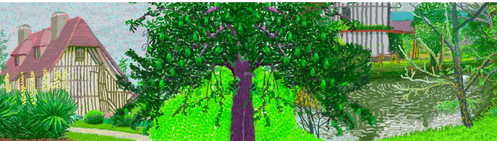
David Hockney - A Year in Normandie (Detail) Composite Ipad painting

Depuis que l'artiste britannique David Hockney a posé ses valises en Normandie en 2019, il a eu l'envie prégnante de s'inspirer du récit déroulant des scènes de la Tapisserie de Bayeux pour créer une œuvre immense, déclinant le cycle des saisons. Niché au cœur de sa vallée augeronne pendant la période des confinements successifs imposés par la pandémie, il va dépeindre à la manière des impressionnistes les effets de lumière des ciels normands et surtout l'arrivée du printemps. Grâce aux pinceaux numériques de son Ipad, une technologie qu'il utilise depuis une douzaine d'années, David Hockney capture l'éclosion de la nature, autour de sa maison à colombages typique du Pays d'Auge, et fige ses variations avec ardeur sur l'écran avec des teintes vives et colorées.